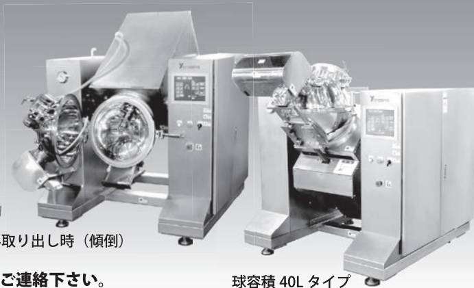
原料取り出し時 (傾倒)

また、減圧機能 (真空ポンプ搭載) と自在なナイフ回転制御により、多彩なペースト化が可能です。