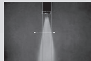
アプリケーション例